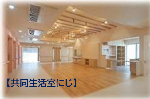
【共同生活室にしじ】